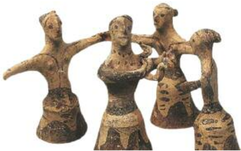
28. Γυναικείος κυκλικός χορός πήλινο ομοίωμα, Παλαιόκαστρο 1400 π.Χ. / Clay figures of women dancing.

Οι γυναίκες είχαν ξεχωριστή θέση στην μινωική κοινωνία. Έπαιρναν μέρος στις γιορτές, τα αγωνίσματα και τις θυσίες. Ντυνόταν με κομψά φορέματα, φορούσαν κοσμήματα και χτένιζαν όμορφα τα μαλλιά τους.