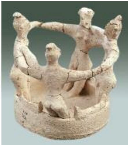
27. Ανδρικός κυκλικός χορός με λαβή από τους ώμους. Πήλινο ομοίωμα από το θολωτό τάφο στοῦ Καμηλάρη Μεσαράς, 1650 π.Χ. / Clay figures of men performing circle dance, holding each other's shoulders.