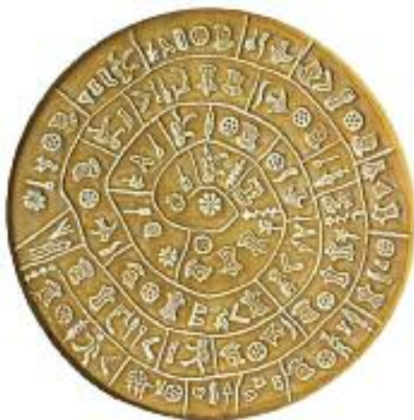
19. Ο δίσκος της Φαιστού. Μουσείο Ηρακλείου. / The Phaestos Disc. Heraklion Museum.

Η πρώτη μινωική γραφή αποτελείται από σύμβολα που μοιάζουν με ιερογλυφικά. Το πιο γνωστό δείγμα μινωικής γραφής έχει βρεθεί στον πήλινο δίσκο της Φαιστού. Τα σύμβολα έχουν αποτυπωθεί στις δύο πλευρές του με σφραγίδες. Παριστάνουν ανθρώπινες μορφές, ψάρια, πουλιά, έντομα, φυτά. Δεν γνωρίζουμε το περιεχόμενό τους, αφού δεν έχουν διαβαστεί μέχρι σήμερα.