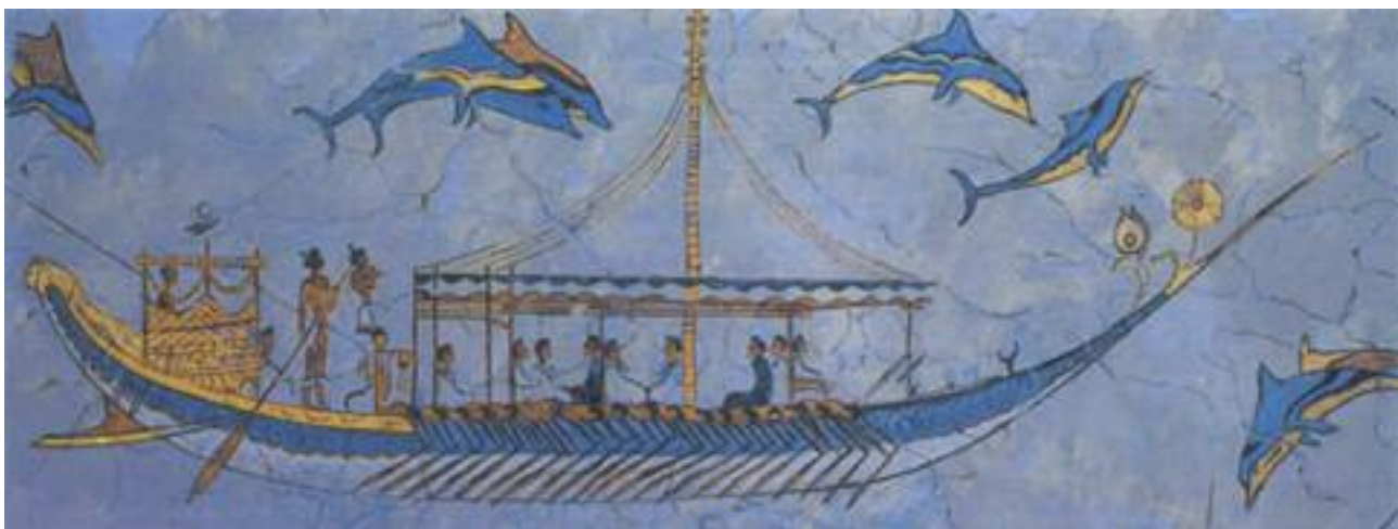
3. Τοιχογραφία από το Ακρωτήριο της Θήρας, που απεικονίζει Μινωικό πλοίο. / Fresco (wall painting) at Akrotiri, Thera depicting a Minoan ship.

Την εποχή αυτή άρχισε η « Μινωική θαλασσοκρατία ». Οι Μινωίτες ταξίδευαν με τα πλοία τους στη Μεσόγειο ιδρύοντας αποικίες σε πολλά μέρη, όπως τα Κύθηρα και τη Μήλο. Είχαν εμπορικές σχέσεις με τις Κυκλάδες, την Αίγυπτο, τη Συρία και την Κύπρο. Έφερναν χαλκό, άργυρο (ασήμι) και άλλα μέταλλα και έφτιαχναν όπλα, εργαλεία και καλλιτεχνήματα. Πουλούσαν σε άλλες περιοχές λάδι, κρασί, λίθινα και πήλινα αγγεία, υφάσματα και δέρματα.