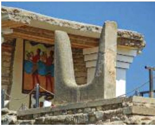
25. Διπλά κέρατα στο παλάτι της Κνωσσοῦ. Ιερό σύμβολο της μινωικής θρησκείας. / Double horns at the palace of Knossos. Sacred symbol of the Minoan religion.