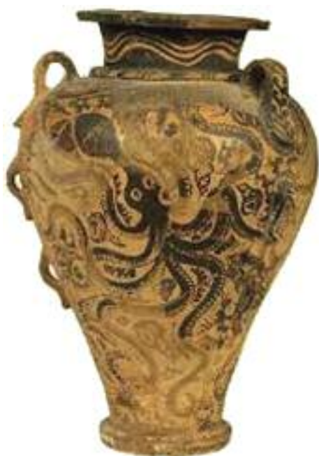
17. Πιθαμφορέας με θαλάσσια διακόσμηση από χταπόδια, τρίτωνες, βράχια και κοράλια. / Amphora decorated with an underwater scene.