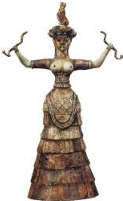
22. Ειδώλιο που απεικονίζει γυναικεία θεότητα να κρατά δύο φίδια. Μουσείο Ηρακλείου. / The snake goddess. Faience figurine found at the temple repository at Knossos.

Την άνοιξη γιόρταζαν τη μεγάλη γιορτή, τα «Ταυροκαθάψια». Ο ταύρος ήταν το ιερό ζώο των Μινωιτών και ιερά σύμβολα τα κέρατα του ταύρου και ο διπλός πέλεκυς. Στη γιορτή αυτή νέοι και νέες έκαναν ακροβατικές ασκήσεις πάνω σε ταύρους.