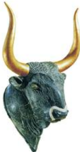
23. Κεφάλι ταύρου. Μουσείο Ηρακλείου. / Bull's head found at the temple repository.