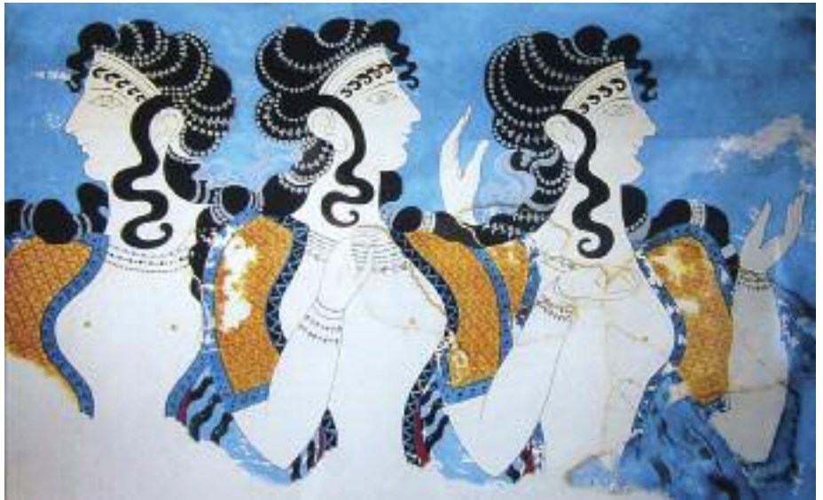
30. Οι γαλάζιες κυρίες. / The Blue Ladies.