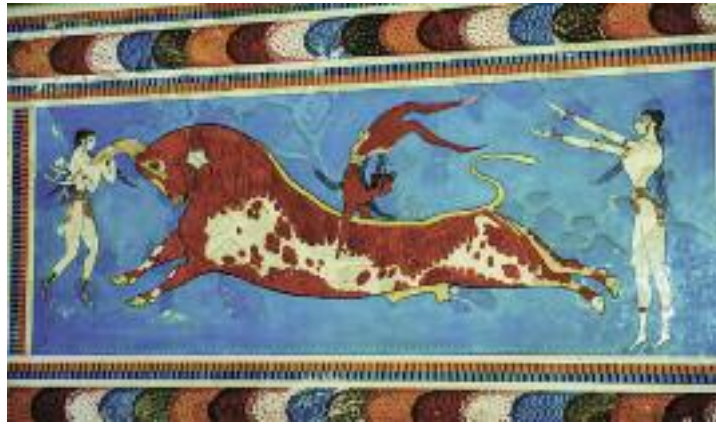
26. Τοιχογραφία (fresco) που αναπαριστά ακροβατικά πάνω σε ταύρο από το παλάτι της Κνωσσοῦ. Μουσείο Ηρακλείου. / Bull Games (Taurokatharsia). From a room at the East wing of Knossos palace.