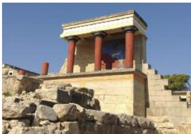
7. Τμήμα του μινωικού παλατιού της Κνωσσού, όπως σώζεται σήμερα. / The Minoan palace at Knossos, as it is today.

Το πιο ονομαστό ήταν το παλάτι της Κνωσσού. Είναι το θρυλικό παλάτι του βασιλιά Μίνωα που αναφέρεται από τους αρχαίους Έλληνες σε «Λαβύρινθος». Ακόμη και σήμερα κάνουν εντύπωση στον επισκέπτη τα πολλά δωμάτια, οι διάδρομοι, οι φωταγωγοί, οι σκάλες και οι κολόνες.