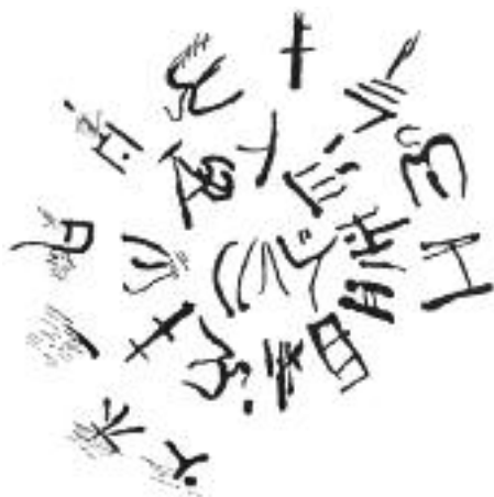
20. Μινωική γραφή: Γραμμική Α. / Minoan writing: Linear A.