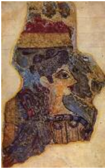
29. Η Παριζιάνα. / La Parisienne.