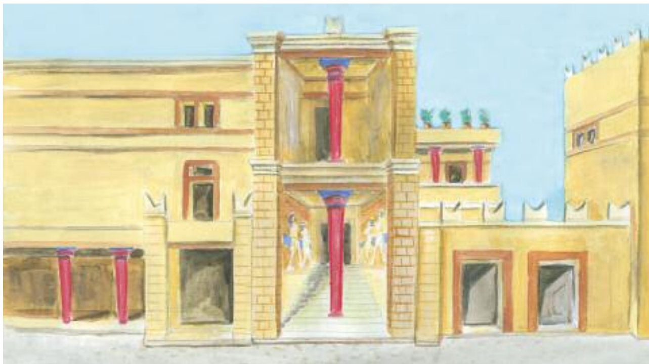
6. Αναπαράσταση Μινωικού παλατιού στην Κνωσσό. / Reconstruction of Minoan palace at Knossos.

Τα μινωικά ανάκτορα ήταν μεγάλα, πολυώροφα συγκροτήματα κτηρίων γύρω από μια κεντρική αυλή. Έμοιαζαν με μικρές πόλεις.