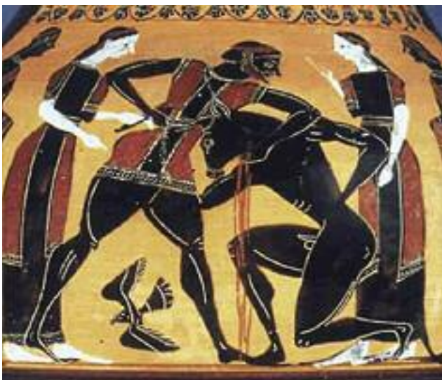
9. Μελανόμορφο αγγείο με το Θησέα και το Μινώταυρο. / Black-figure vase with Theseus and the Minotaur.

Ο Μινώταυρος ήταν ένα μυθικό τέρας με κεφάλι ταύρου και σώμα ανθρώπου. Κατοικούσε στον Λαβύρινθο, κτίσμα που σχεδιάστηκε από τον Δαίδαλο, κατόπιν εντολής του βασιλιά της Κρήτης, Μίνωα. Κάθε εννέα χρόνια επτά νέοι και επτά νέες από την Αθήνα στέλνονταν στην Κρήτη τροφή για τον Μινώταυρο. Αυτό ήταν η τιμωρία των Αθηναίων, επειδή κάποτε είχαν σκοτώσει τον γιο του Μίνωα, τον Ανδρόγεω. Οι δεκατέσσερις νέοι έφευγαν για την Κρήτη με ένα καράβι με μαύρα πανιά, που αφού