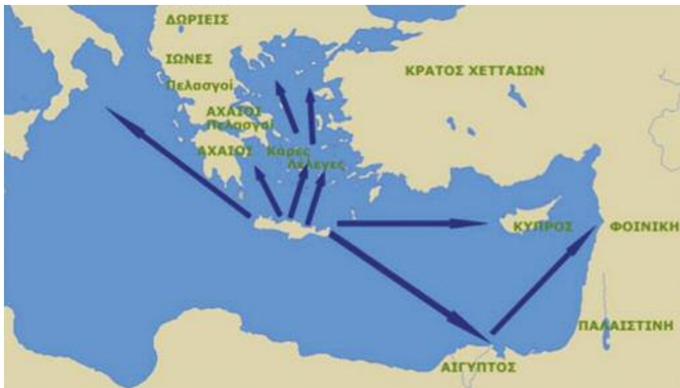
1. Η προνομιακή θέση της Κρήτης στους θαλάσσιους δρόμους της Ανατολικής Μεσογείου. / The ideal position of Crete among the sea lanes of Eastern Mediterranean.