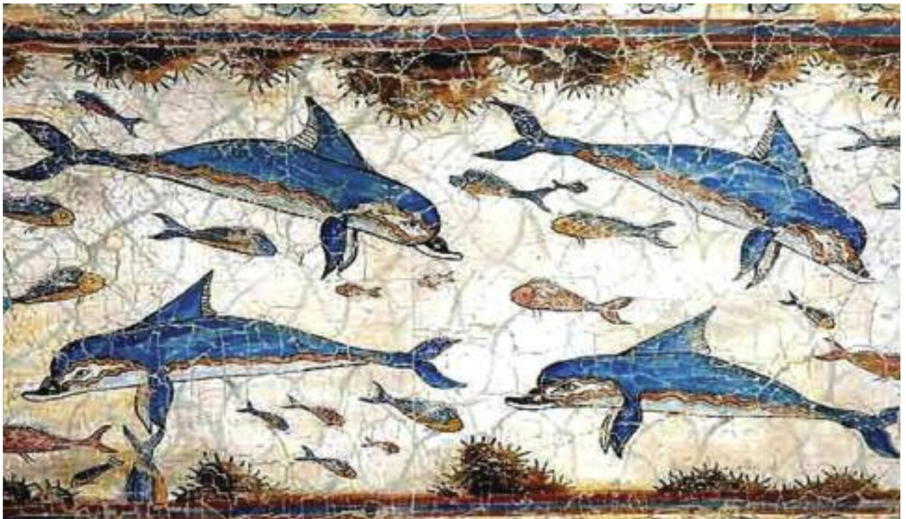
10. Τοιχογραφία δελφινιών από το δωμάτιο της βασίλισσας. / Wall painting with dolphins from the queen's halls.

Η τέχνη των Μινωιτών φαίνεται από τις τοιχογραφίες με ζωντανά χρώματα που διακοσμούσαν τους τοίχους του παλατιού και παρίσταναν πρίγκηπες, βασιλοπούλες, λουλούδια, πουλιά και ψάρια.