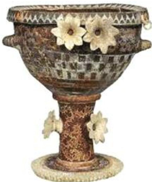
15. Μινωικό αγγείο διακοσμημένο με κρίνα. / Minoan Vase decorated with lilies.