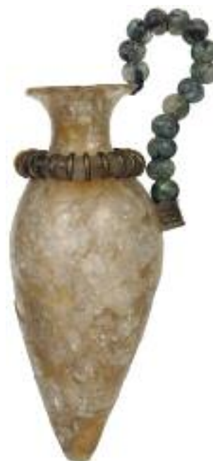
18. Ρυτό αγγείο από τη Ζάκρο. / Rhinestone amphora, from Zakro, Crete.