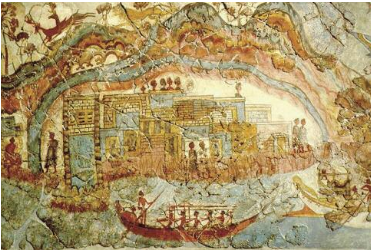
33. Τοιχογραφία από το Ακρωτήρι που απεικονίζει πλούσιο λιμάνι της Θήρας. (photo: Wikipedia). / Wall painting from Akrotiri depicting the rich port of Thera.

Η έκρηξη του ηφαιστείου της Θήρας ήταν πιθανότατα η αιτία της καταστροφής του Μινωικού πολιτισμού. Τεράστια κύματα, καταστροφικοί σεισμοί και ηφαιστειακή τέφρα (στάχτη) σάρωσαν τις ακτές της Κρήτης. Ωστόσο, το παλάτι της Κνωσσού δεν καταστράφηκε από την έκρηξη. Για λίγα χρόνια έγινε η έδρα των Αχαιών-Μυκηναίων που ήρθαν από την Πελοπόννησο και κατέλαβαν το νησί.