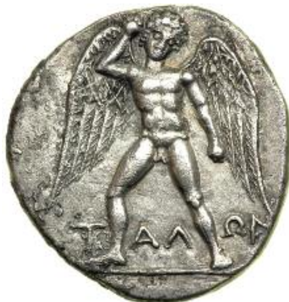
5. Νόμισμα της Φαιστού, 280 π.Χ. Ο φτερωτός Τάλως οπλισμένος με πέτρα. / The winged Talos holding a stone. Coin from Faistos, 280 B.C.