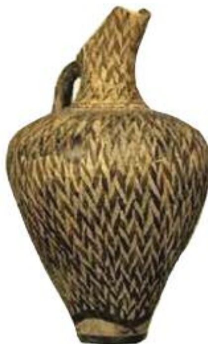
16. Πρόχους με φυτική διακόσμηση από τη Φαιστό. / Pitcher decorated with plants.