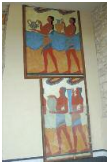
31. Νεαροί Μινωίτες ντυμένοι με το ζώμα. (Αναπαράσταση). / Young men from Minoan Crete.