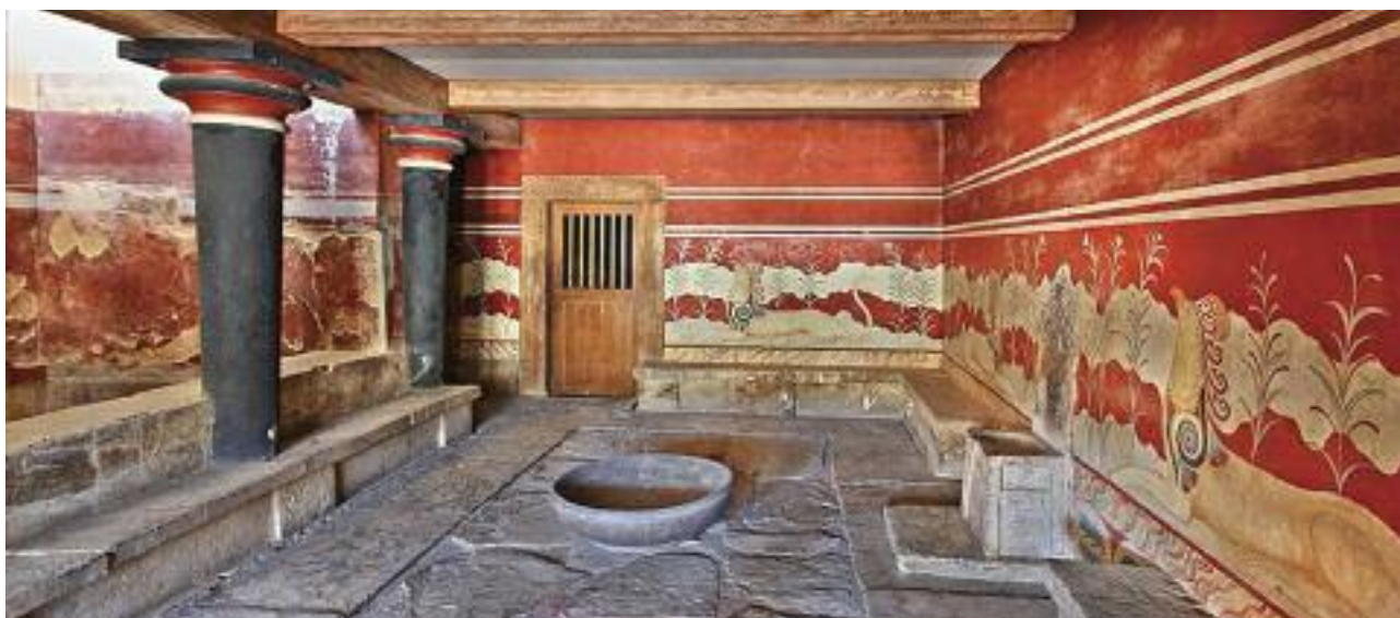
8. Η αίθουσα του θρόνου στο παλάτι της Κνωσού. / The throne chamber at Knossos.

Ο μαθητής κρατούσε μια πλάκα από μαλακό πηλό και πάνω της μάθαινε να χαραρίζει τα παράξενα σημάδια της μινωικής γραφής.