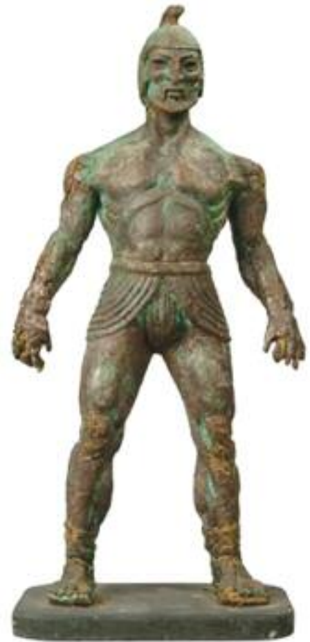
4. Ο Τάλως. / Talos.

Οι Αργοναύτες γυρίζοντας από την Κολχίδα έφτασαν στα νότια της Κρήτης. Ήταν κουρασμένοι και ήθελαν τροφή αλλά ο γίγαντας δεν τους άφηνε να πλησιάσουν το νησί. Τότε η Μήδεια μάγεψε με τα λόγια της τον γίγαντα και ο Ιάσοντας κατάφερε να αφαιρέσει το καρφί που έκλεινε τη μοναδική φλέβα που είχε το σώμα του, με αποτέλεσμα ο γίγαντας να πεθάνει.