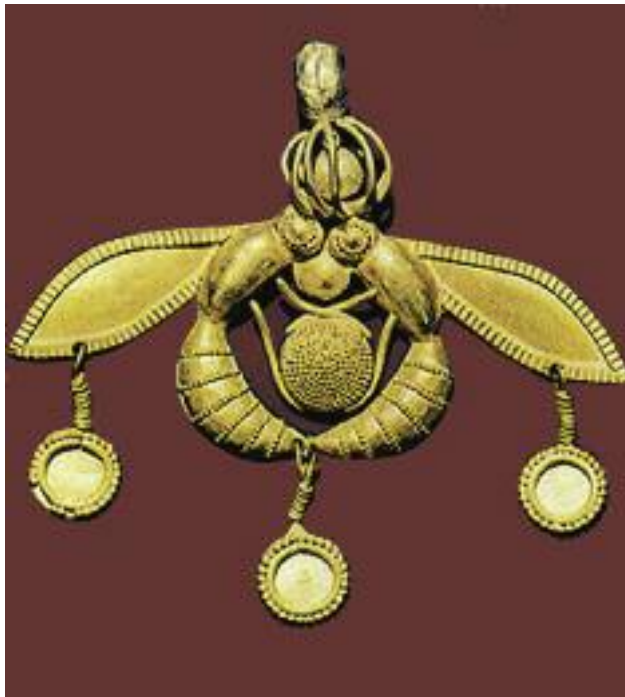
13. Χρυσό περιδέραιο από τα Μάλια με δύο μέλισσες να αφήνουν μέλι σε κηρήθρα. Μουσείο Ηρακλείου. / Gold pendant from Mallia with two wasps leaving honey in a honeycomb. Herakleion Archeological Museum.