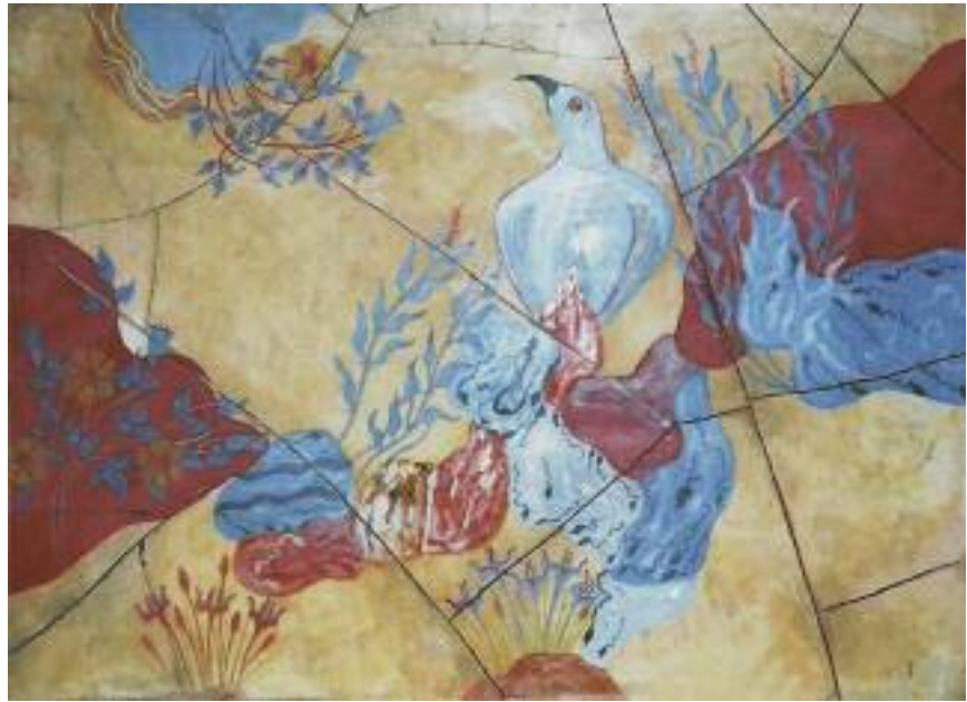
11. Ο πρίγκηπας με τα κρίνα (τοιχογραφία), Μουσείο Ηρακλείου. / The prince with the Lilies (wall painting). 12. Το γαλάζιο πουλί. Μουσείο Ηρακλείου. / The Blue Bird. Heraklion Museum.