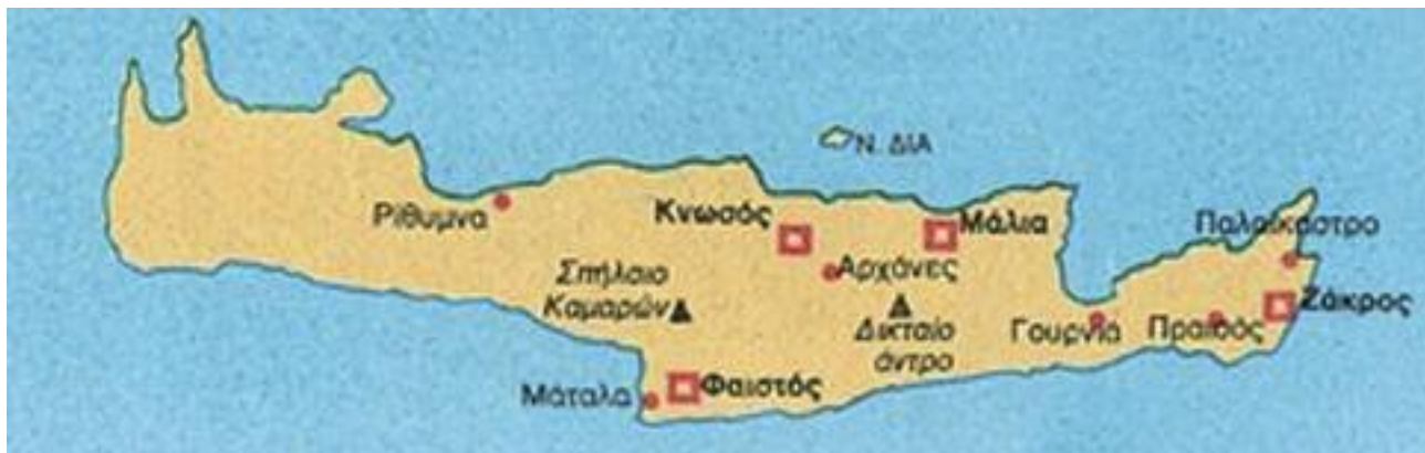
2. Χάρτης Μινωικής Κρήτης με τα ανάκτορα, τους οικισμούς και τα σπήλαια της θρησκευτικής λατρείας. / Map of Minoan Crete with the palaces, settlements and caves where religious ceremonies took place.

ανάκτορα (παλάτια). Αυτά καταστράφηκαν όμως από σεισμό και ξανακτίστηκαν αργότερα ακόμα μεγαλύτερα και πιο επιβλητικά. Σε πολλούς οικισμούς βρέθηκαν και «μινωικές επαύλεις», που μοιάζουν με μικρογραφίες των ανακτόρων. Δεν υπήρχαν οχυρώσεις γύρω από τα ανάκτορα και τους οικισμούς, επειδή επικρατούσε ειρήνη στην περιοχή.