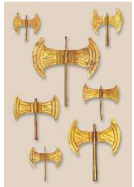
24. Χρυσοί διπλοί πελέκεις που βρέθηκαν σε σπήλαιο. Μουσείο Ηρακλείου. / Golden double axes found in a cave. Heraklion Museum.